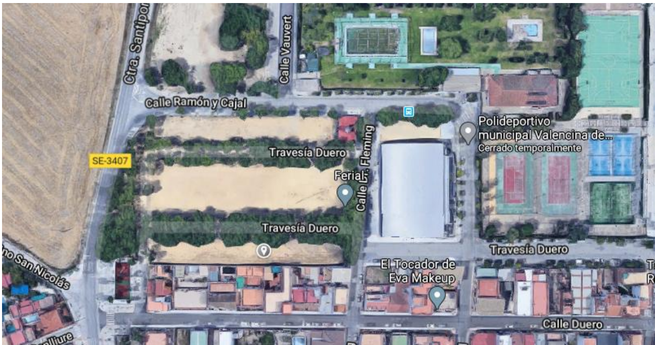
Ilustración 1: Lugar de salida y meta.

La carrera se celebrará el domingo día 20 de septiembre de 2020 a las 09:30 horas con salida y llegada en el recinto ferial, sita en la Calle Travesía Duero, junto al Polideportivo Municipal de Valencina de la Concepción.