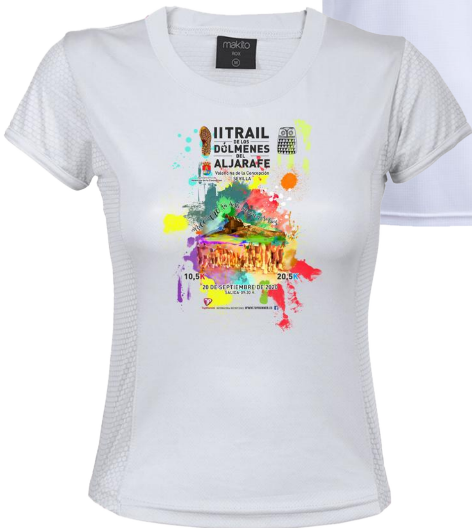
Reglamento II Trail de los Dólmenes del Aljarafe. Valencina de la Concepción, 20 de septiembre de 2020.